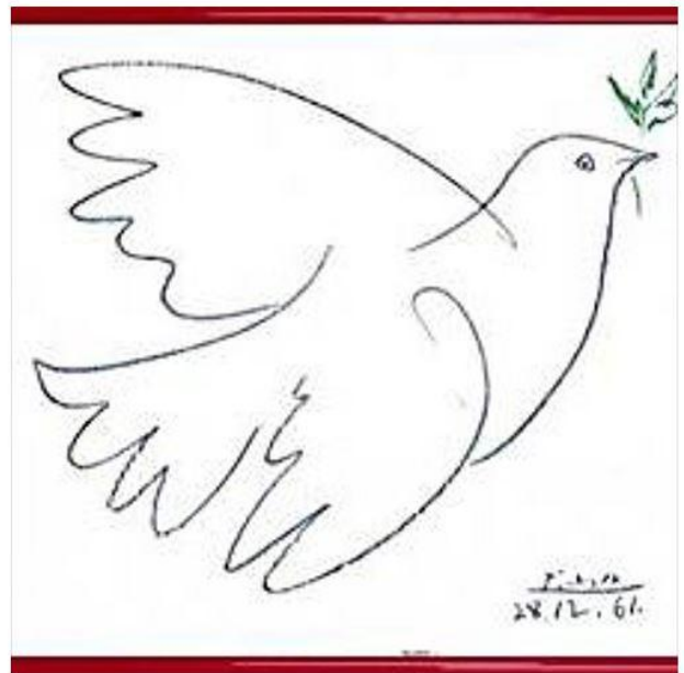
La Paloma - Rafael Alberti